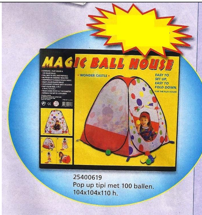
25400619 Pop up tipi met 100 ballen. 104x104x110 h.