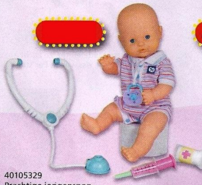
40105329 Prachtige jongenspop. Kleed mij aan, geef mij mijn badje en als ik honger heb wil ik mijn papflesje. Ik maak blaasjes en zit graag op mijn potje, maar vooral ben ik heel lief. 42 cm.