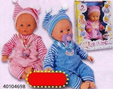
40104698 Babyland pop zacht 5 functies. 30 cm. +3j. 3XLR44 INCL