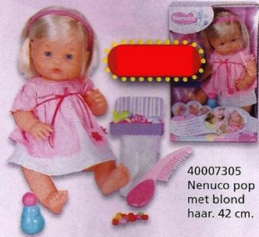
40007305 Nenuco pop met blond haar. 42 cm.