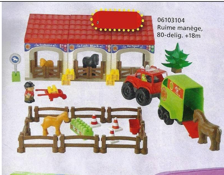
06103104 Ruime manège, 80-delig. +18m