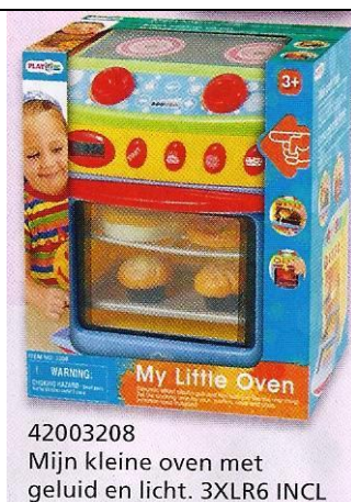
42003208 Mijn kleine oven met geluid en licht. 3XLR6 INCL