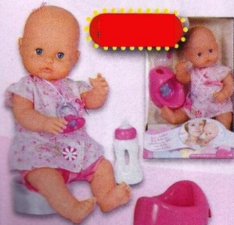
40105328 Prachtige meisjespop. Kleed mij aan, geef mij mijn badje en als ik honger heb zit graag op mijn potje, maar vooral ben ik heel lief. 42 cm.