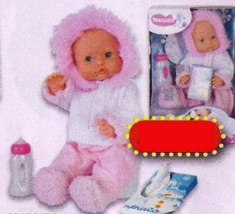
40108176 Nenuco baby met lopende neus. 42 cm.