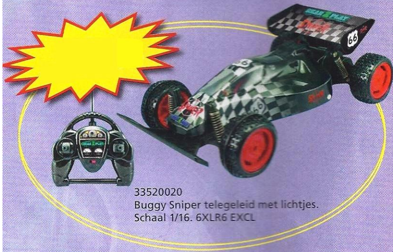
33520020 Buggy Sniper telegeleid met lichtjes. Schaal 1/16. 6XLR6 EXCL