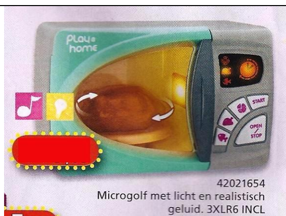
42021654 Microgolf met licht en realistisch geluid. 3XLR6 INCL